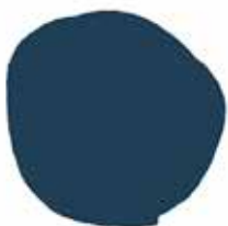
PANTONE 532 C R:34 G:49 B:78 #22314e

A continuación amosanse as cores corporativas. A súa correcta utilización fortalecerá a imaxe global da marca.