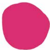
PANTONE 214 C R:207 G:3 B:96 #cf0360