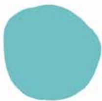
PANTONE 7472 C R:85 G:186 B:183 #55bab7