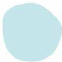
PANTONE 628 C R:192 G:226 B:230 #c0e2e6