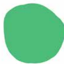
PANTONE 7489 C R:115 G:147 B:87 #73ae57